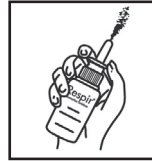
3. Dirigir hacia la nariz y presionar hacia abajo.