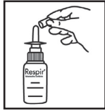
1. Quitar tapón de protección.

Frasco con bomba pulverizadora: Quitar el tapón de protección, dirigir hacia la fosa nasal y presionar hacia abajo el dispositivo pulverizador. Ver dibujos ilustrativos: