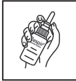
2. Colocar en la mano sujetando el frasco entre la palma y los dedos índice y pulgar.